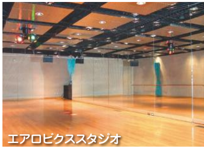
エアロビクススタジオ