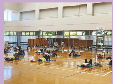
「ピラティス」・「バレトン」 体験レッスンの様子