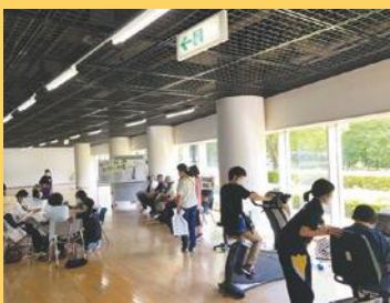
健康づくりセンター紹介 器機体験会場は大盛況!