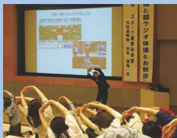
講演会 筋肉体操と超ラジオ体操とお散歩